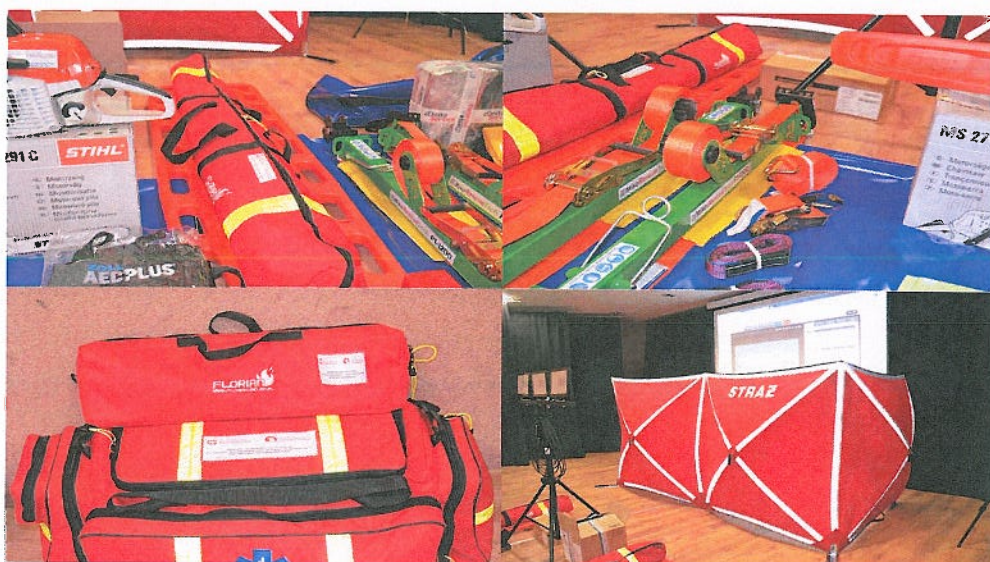
Fotografia nr 14. Przekazanie sprzętu dla OSP