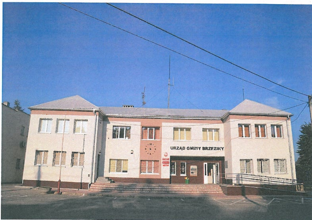
Fotografia nr 8. Urząd Gminy Brzeziny

Przedstawione cele wpisują się w cel tematyczny i szczegółowy Działania 3.2.4. WRPO 2014+ poprzez wspieranie przejścia na gospodarkę niskoemisyjną w sektorze publicznym oraz zwiększenie efektywności energetycznej sektora publicznego.