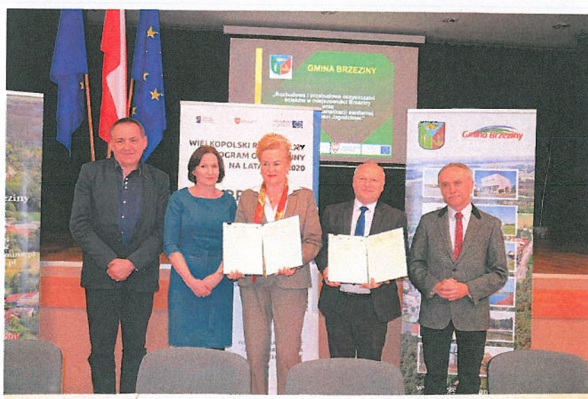
Fotografia nr 15. Podpisanie umowy „Rozbudowa i przebudowa oczyszczalni ścieków w miejscowości Brzeziny wraz z budową sieci kanalizacji sanitarnej w miejscowości Jagodziniec”