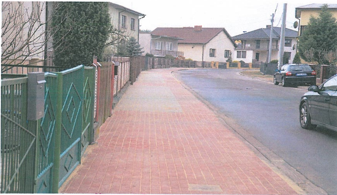
Fotografia nr 13. Chodnik przy ul. Piłsudskiego w Brzezinach