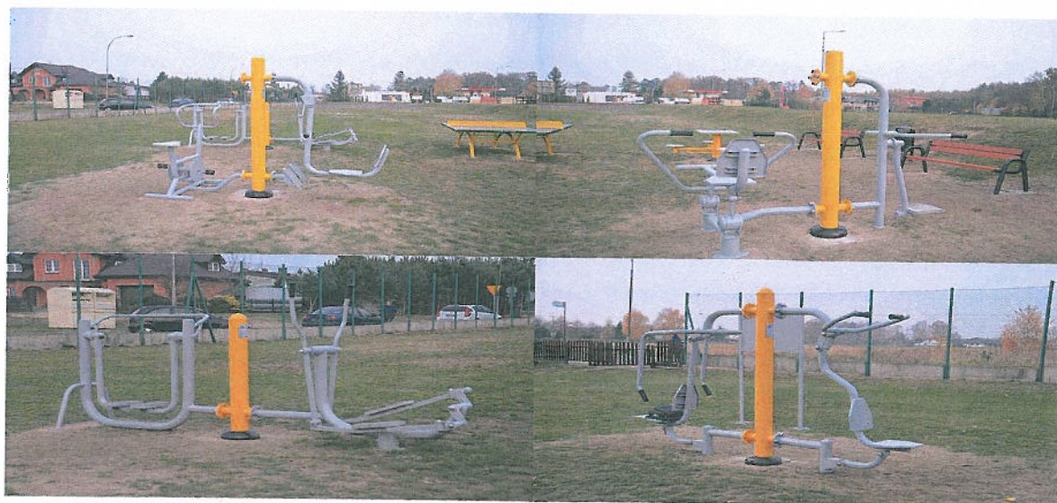
Fotografia nr 12. Otwarta Strefa Aktywności przy Gimnazjum w Brzezinach Źródło własne.

Kwota dofinansowania ze środków Ministerstwa Sportu i Turystyki wynosi 26.200,00 PLN.