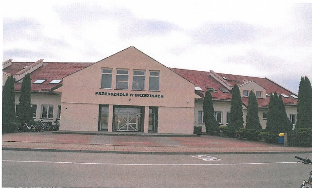
Fotografia nr 9. Przedszkole w Brzezinach

Przedstawiony cel główny jest zgodny z założeniami Regionalnego Programu Operacyjnego Województwa Wielkopolskiego 2014-2020 w tym z celem Osi priorytetowej 3 „Energia” realizowanej w ramach działania 3.2 Poprawa efektywności energetycznej w sektorze publicznym i mieszkaniowym oraz z celem szczegółowym poddziałanie 3.2.4 Poprawa efektywności energetycznej w sektorze publicznym w ramach ZIT dla rozwoju AKO.