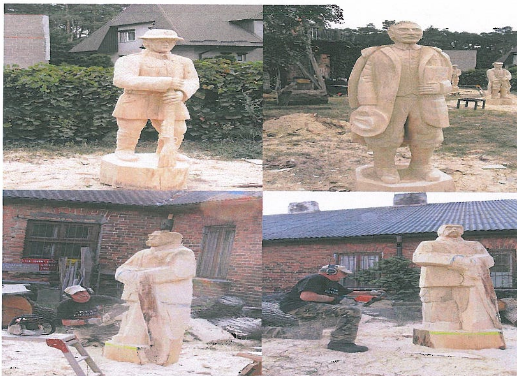
Fotografia nr 5. Brzeziny dłutem malowane