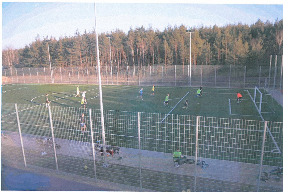
Fotografia nr 7. ORLIK w Brzezinach

Do najważniejszych obiektów sportowych należy kompleks boisk ze sztuczną nawierzchnią „Moje boisko-Orlik 2012”