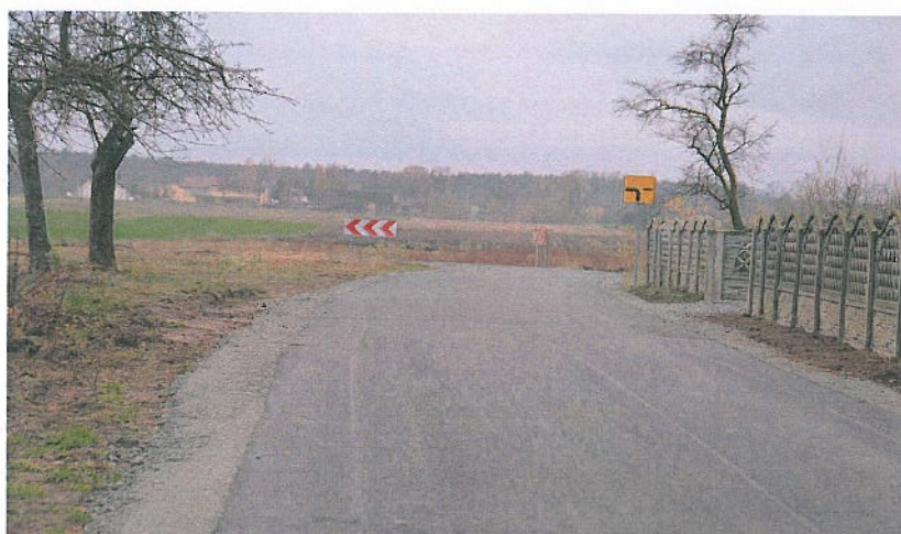
Fotografia nr 11. Droga gminna w miejscowości Jamnice Źródło własne.