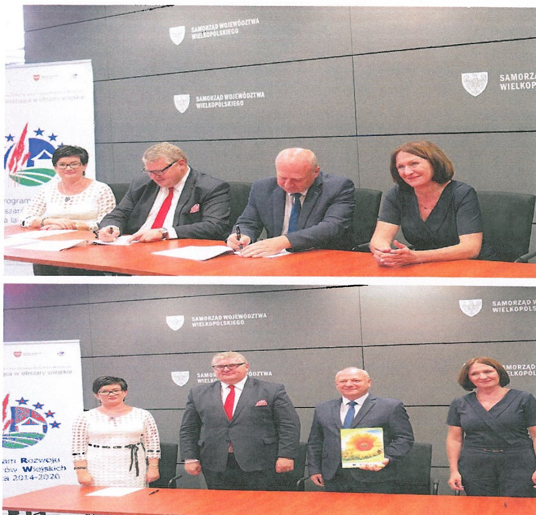
Fotografia nr 16. Podpisanie umowy „Rozwój infrastruktury rekreacyjno-kulturalnej na terenie Gminy Brzeziny poprzez przebudowę części istniejącego budynku Ochotniczej Straży Pożarnej w miejscowości Przystajnia Kolonia z przeznaczeniem pomieszczeń na cele świetlicy wiejskiej”