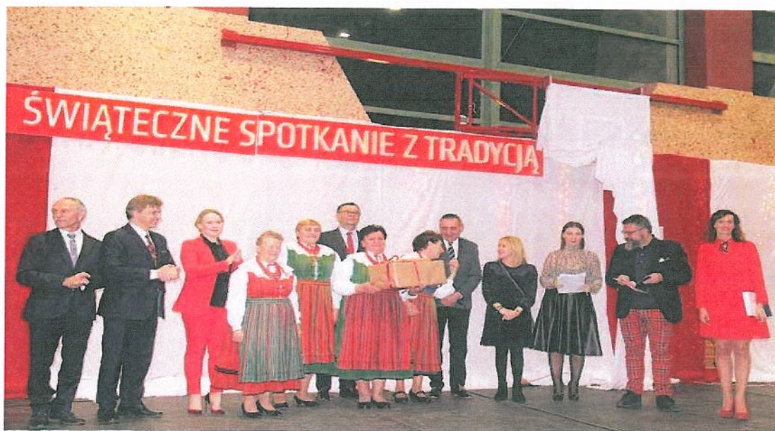
Fotografia nr 6. Spotkanie z Tradycją w Liskowie

tym roku zaproszeni goście mogli spróbować wspaniałych potraw z 14 stołów wigilijnych przygotowanych przez Koła Gospodyń Wiejskich, stowarzyszenia, zespoły ludowe i szkoły z terenu gmin powiatu kaliskiego.