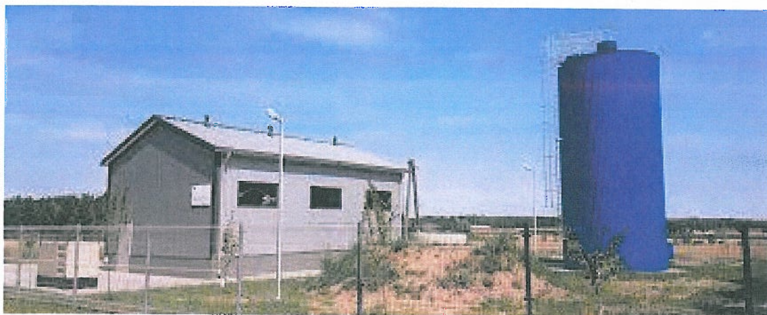
Fotografia nr 10. SUW w Piegonisku Wsi

Jednym z zadań realizowanych w zakresie ochrony środowiska była operacja pn. „Poprawa stanu gospodarki wodnej poprzez budowę stacji uzdatniania wody w miejscowości Piegonisko Wieś oraz wyposażenie stacji uzdatniania wody w miejscowości Pieczyska” . Przedmiotowa operacja realizowana była w dwóch etapach w roku 2017 i 2018. W ramach operacji w miejscowości Piegonisko Wieś wybudowano nową stację uzdatniania wody oraz dokonano wymiany odcinka sieci wodociągowej, natomiast na Stacji Uzdatniania Wody w miejscowości Pieczyska wyposażono stację w monitoring ograniczania strat wody. Projekt był współfinansowany ze środków Unii Europejskiej na operacje typu „Gospodarka wodno - ściekowa” w ramach poddziałania „Wsparcie inwestycji związanych z tworzeniem, ulepszaniem lub rozbudową wszystkich rodzajów małej infrastruktury, w tym inwestycji w energię odnawialną i w oszczędzanie energii” objętego Programem Rozwoju Obszarów Wiejskich na lata 2014-2020. Celem operacji jest wyeliminowanie niedoboru wody w miejscowości Piegonisko Kolonia, Piegonisko Wieś, Piegonisko Pustkowie, Sobiesęki oraz stworzenie sprawnego monitoringu ograniczania strat wody na stacji uzdatniania wody w miejscowości Pieczyska. Całkowita wartość zadania wyniosła 1.235.264,10 zł brutto Dofinansowanie z Unii Europejskiej – 547.920,80 zł (63,63% kwoty całkowitych kosztów kwalifikowanych operacji).