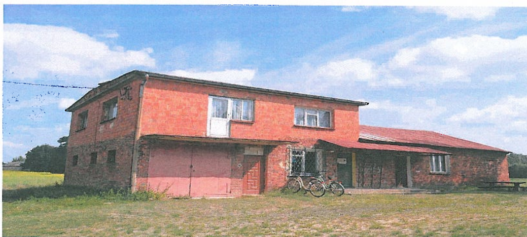
Fotografia nr 16. Budynek świetlicy wiejskiej w miejscowości Przystajnia Kolonia