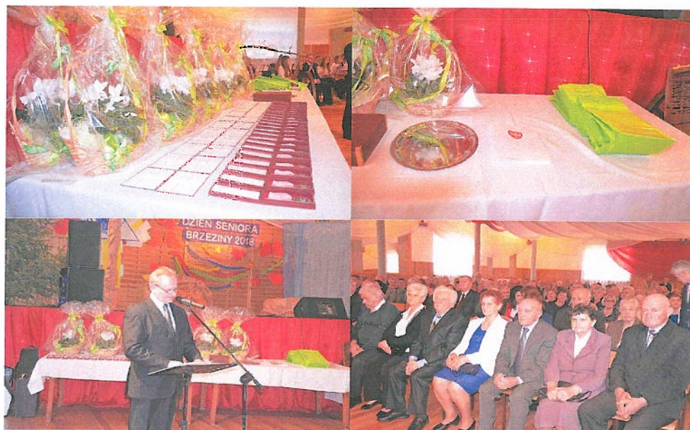
Fotografia nr 4. Gminne Obchody Dnia Serniora