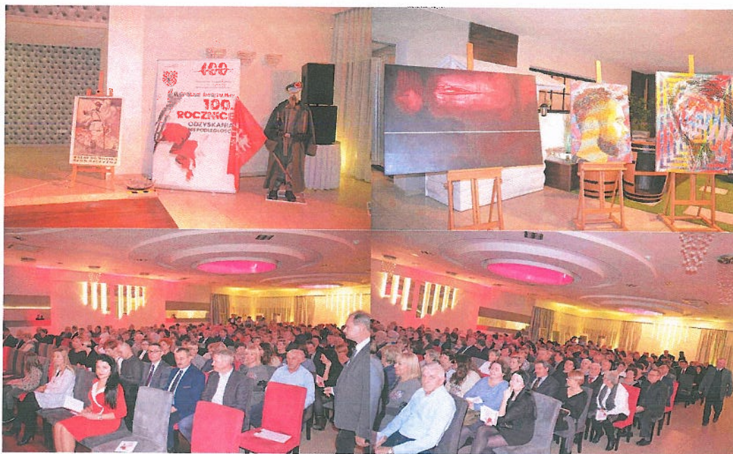
Fotografia nr 3. Koncert patriotyczny „Artyści dla Niepodległości” w Brzezinach