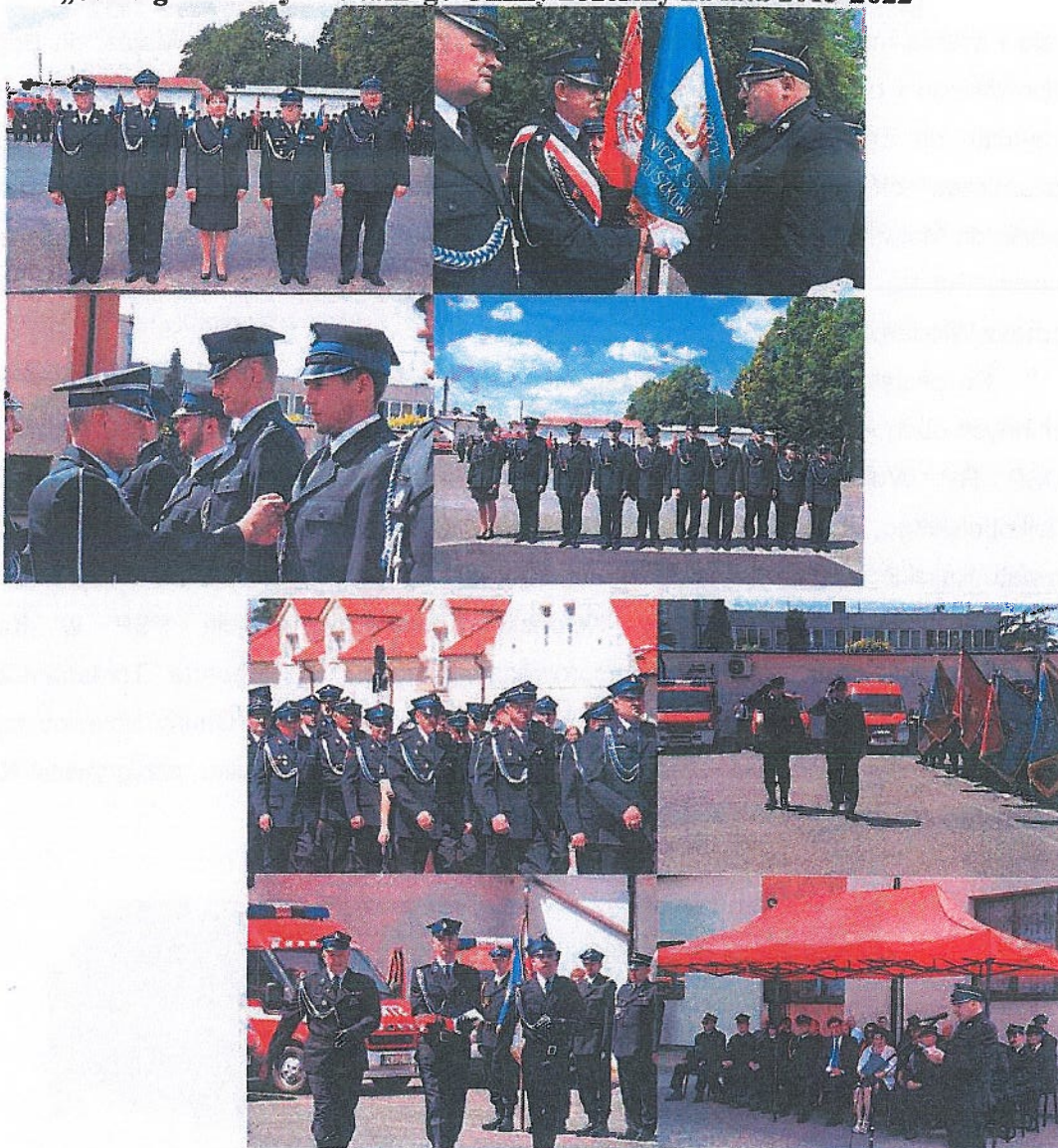
Powiatowo – Gminne obchody Dnia Strażaka