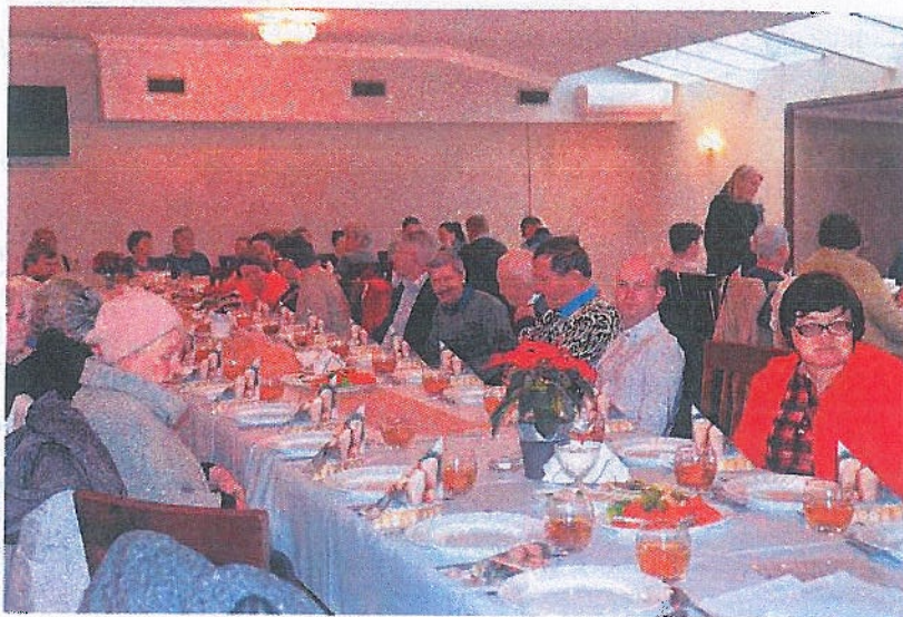
Spotkanie opłatkowe dla osób samotnych