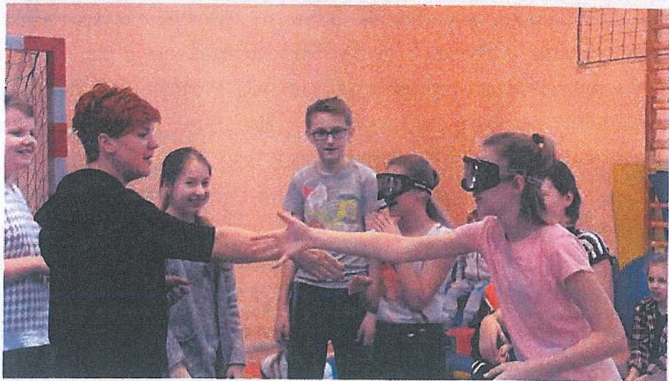
Prelekcja dotycząca szkodliwości alkoholu i narkotyków