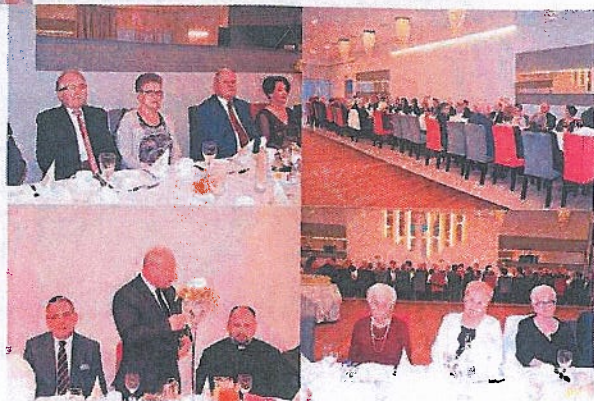
XV Świąteczno-Noworoczne Spotkanie Koła Emerytów i Rencistów z terenu gminy Brzeziny