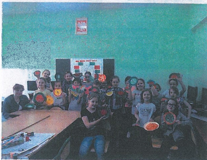
Światowy Dzień Zdrowia