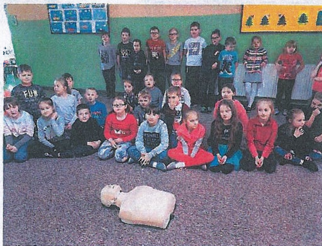
Zajęcia praktyczne z zakresu udzielania pierwszej pomocy w ramach akcji Wielkiej Orkiestry Świątecznej Pomocy „Ratujemy i uczymy ratować”