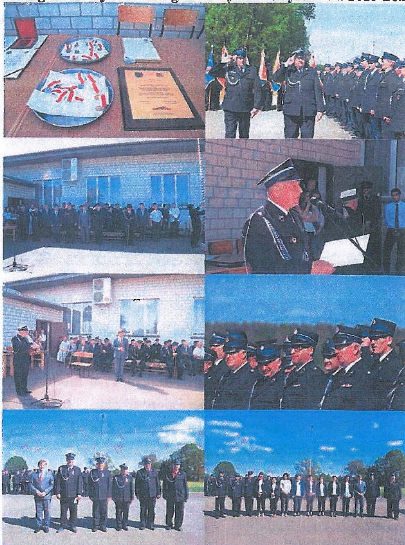
Obchody Gminnego Dnia Strażaka Jubileusz wraz z 70 – leciem powstania Ochotniczej Straży Pożarnej w Fajum