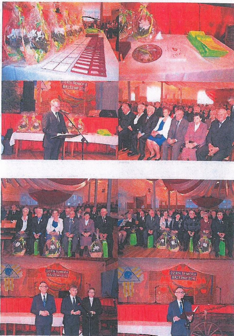
Gminne Obchody „Dnia Seniora”

Od wielu lat Gmina Brzeziny na początku roku obchodzi tradycyjnie Gminny Dzień Seniora. W tym roku odbył się 28 stycznia w sali OSP Brzeziny. Władze gminy zapraszają najstarszych mieszkańców gminy oraz Jubilatów obchodzących „50-lecie Pożycia Małżeńskiego” na uroczystość przygotowaną z myślą o nich. Jest to okazja do spotkania się w gronie znajomych, rozmów, a także do wspólnej zabawy. 11 par małżeńskich z gminy Brzeziny, które w minionym roku obchodziły 50-lecie zawarcia związku małżeńskiego, otrzymały medale „Za długoletnie pożycie małżeńskie” przyznane przez Prezydenta Rzeczypospolitej Polski.