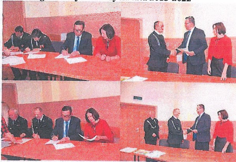
Uroczyste przekazanie dla jednostek Ochotniczych Straży Pożarnych z terenu Gminy Brzeziny wyposażenia i sprzętu ratownictwa