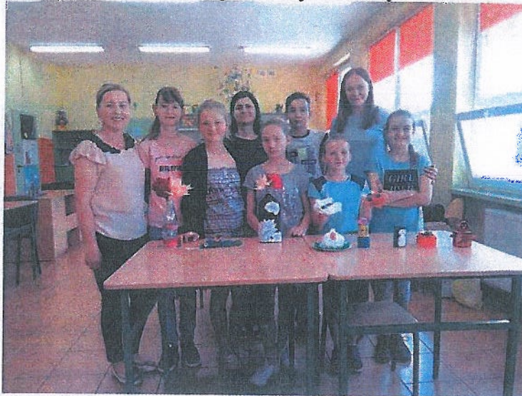
„Baw się w upcykling”