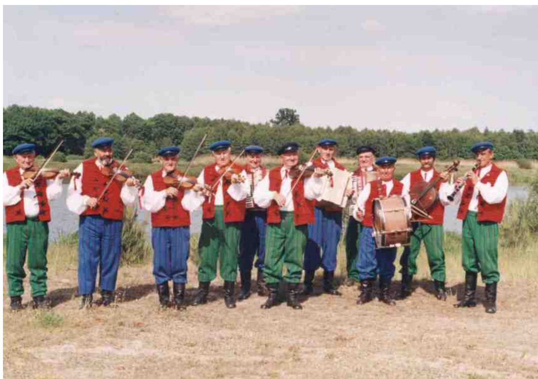
Rysunek 3.3. Kapela Ludowa „Brzeziny”