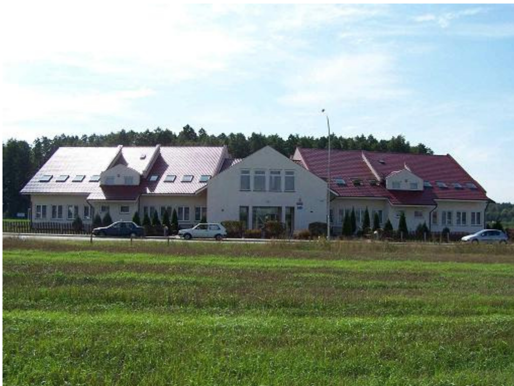
Rysunek 3.1. Gimnazjum Brzezinach

Na terenie gminy znajduje się jedno Przedszkole w Brzezinach. Zlokalizowane jest przy Szkole Podstawowej. Posiada 6 oddziały z 121 dziećmi.