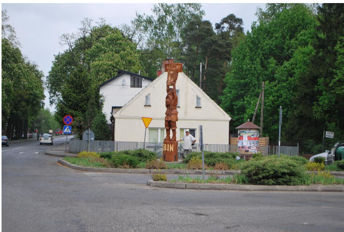
Rysunek 2.2. Skrzyżowanie dróg w miejscowości Brzeziny

W Brzezinach zasadniczą oś założenia tworzy droga przelotowa na osi wschód-zachód (wzdłuż drogi wojewódzkiej 449), od której odchodzi droga w kierunku Kalisza. Podstawowa, zwarta zabudowa wsi koncentruje się przy tych drogach.