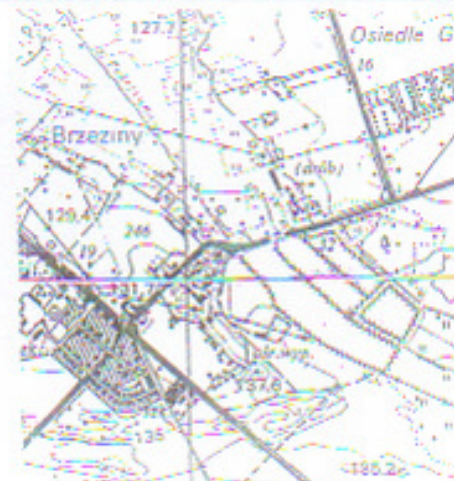
Szkic orientacyjny skala 1: 25000

Załącznik graficzny nr 1 do Uchwały Nr 245/XXVII/13 Rady Gminy Brzeziny z dnia 27 września 2013 r.