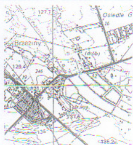
Szkic orientacyjny skala 1: 25000