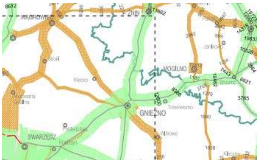
Mapa 2, Dienne natężenie ruchu na drogach wojewódzkich w okolicy Gminy Gniezno