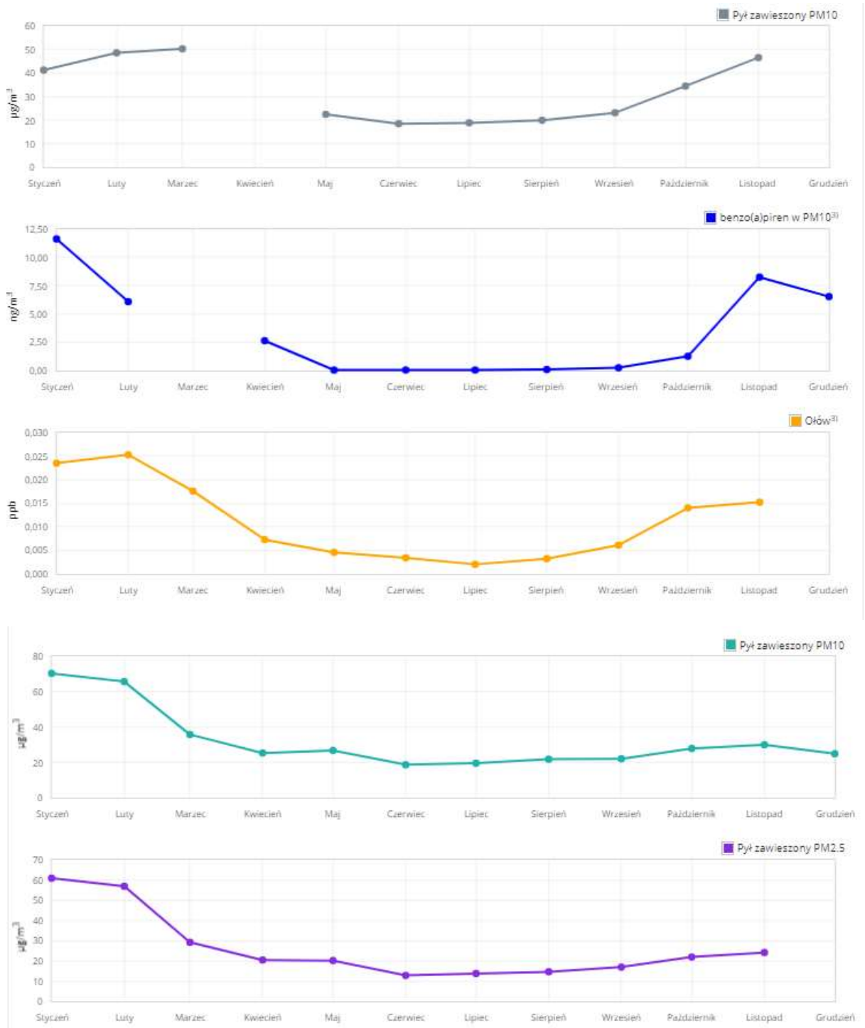
Rysunek 1. Miesięczne poziomy emisji pyłów zawieszonych w roku 2018