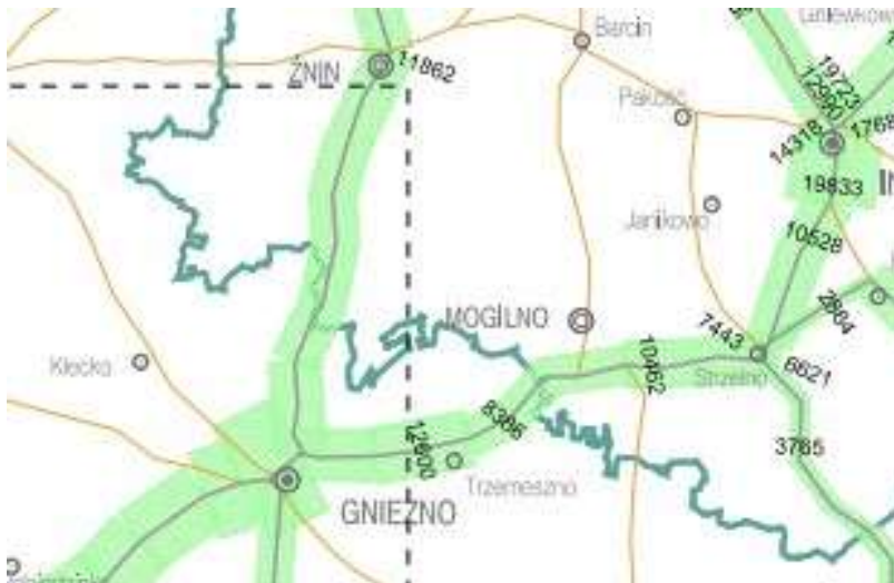
Mapa 1 Dienne natężenie ruchu na drogach krajowych w okolicy Gminy Gniezno