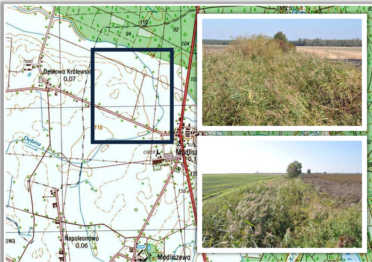
Ryc. 14. Rzeka Dębina w okolicach miejscowości Modliszewko

Struga Sadowiecka ma swój początek w okolicach jeziora Przedwieśnia zlokalizowanego w południowo-zachodniej części gminy Trzemeszno, w bezpośrednim sąsiedztwie Gminy Gniezno. Cały ciek ma 11 km długości, z czego większość znajduje się na terenie Gminy Gniezno. Struga Sadowiecka jest lewobrzeżnym dopływem Strugi Dębowieckiej, do której wpływa w okolicach Dębowca i Ganiny.