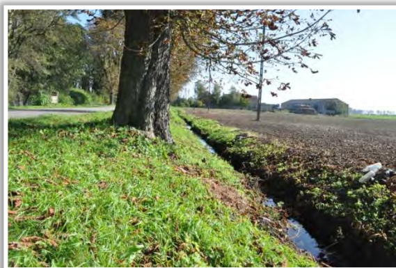
Ryc. 15. Rów odwadniający w okolicach miejscowości Zdziechowa