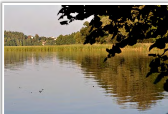
Ryc. 16. Jezioro Wierzbiczańskie w okolicach miejscowości Lubochnia