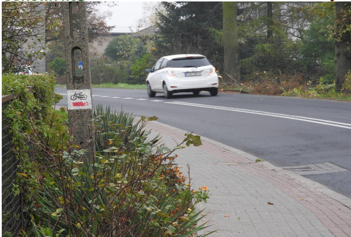
Szlak rowerowy – czerwony