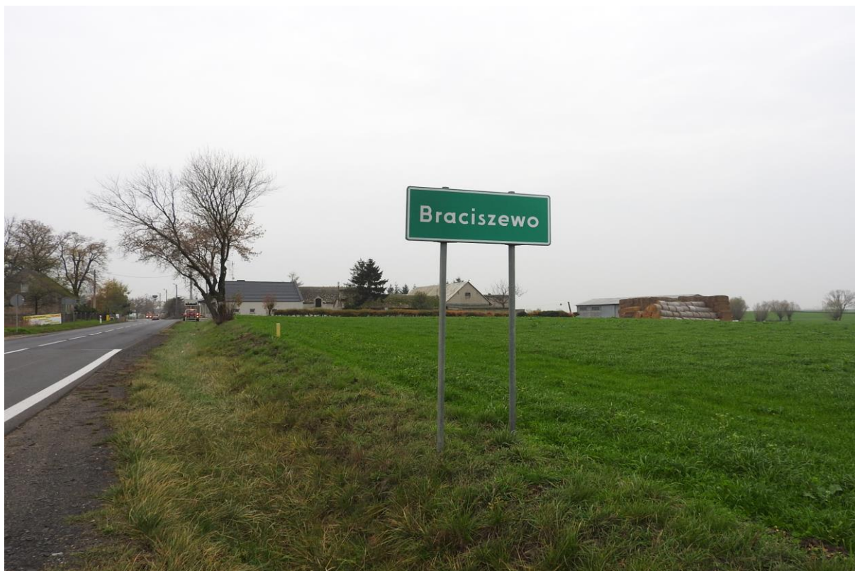
Braciszewo – rolnicza wieś, z widocznymi elementami zabudowy jednorodzinnej