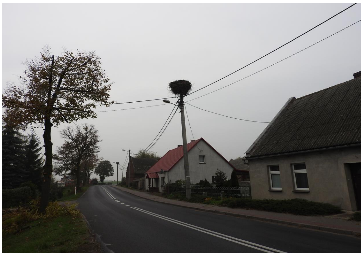
Bocianie gniazda we wsi