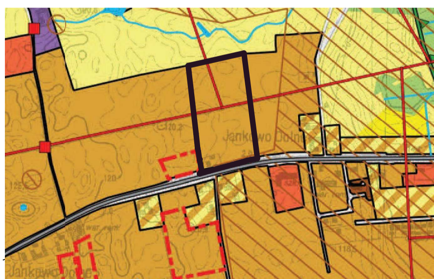
GRANICA OBSZARU OBJĘTEGO PLANEM