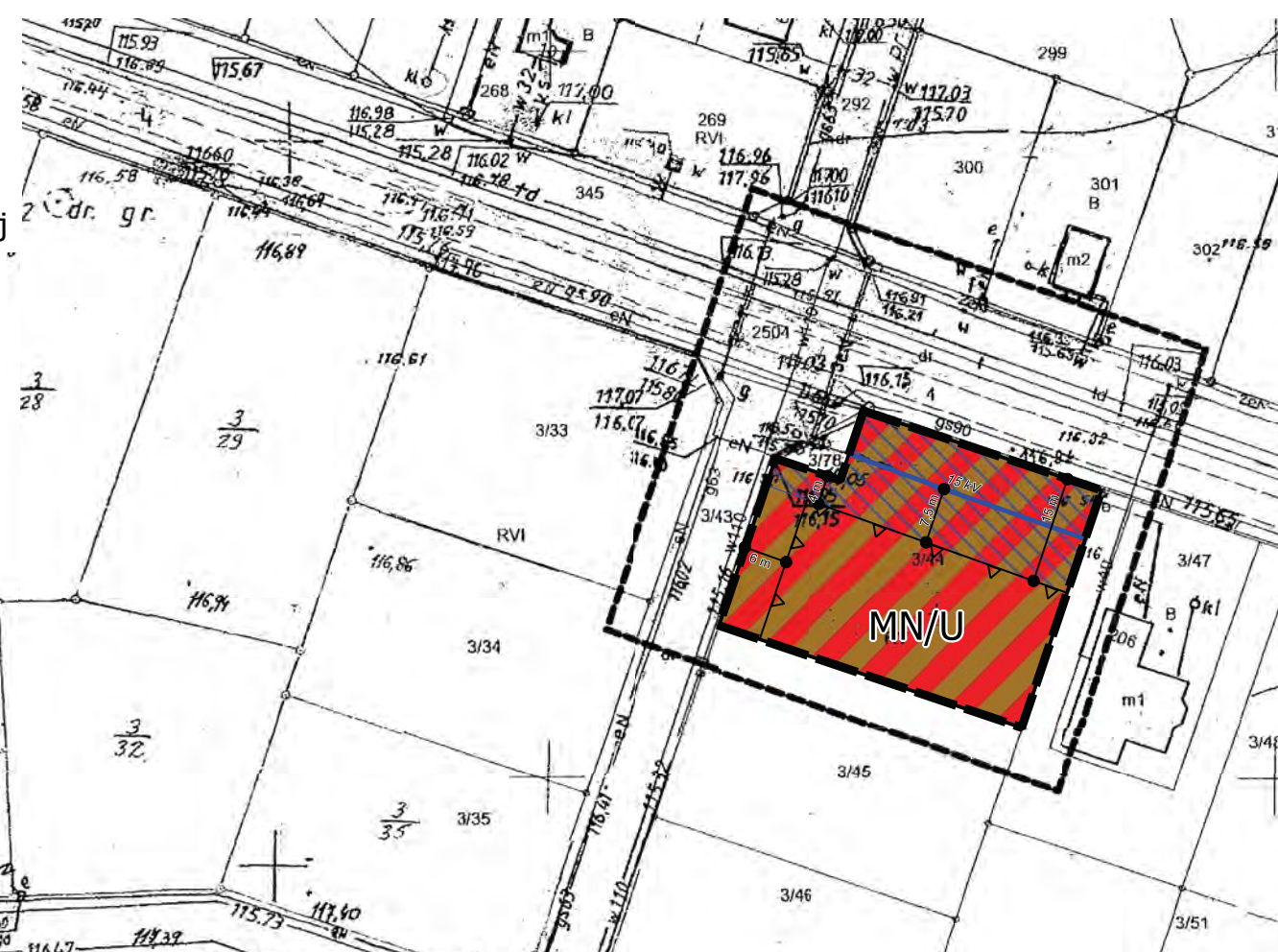
Wyrys ze Studium uwarunkowań i kierunków zagospodarowania przestrzennego gminy Gniezno skala 1:5000