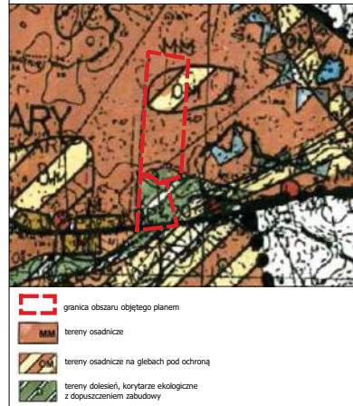
Wyrus ze Studium uwarunkowań i kierunków zagospodarowania przestrzennego gminy Gniezno skala 1:10000

Cały obszar objęty planem położony jest w granicach Głównego Zbiornika Wód Podziemnych nr 143 Subzbiornik Inowrocław-Gniezno.