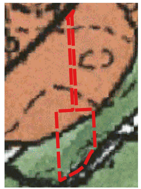
Wyrys ze Studium uwarunkowań i kierunków zagospodarowania przestrzennego Gminy Gniezno SKALA 1:5000