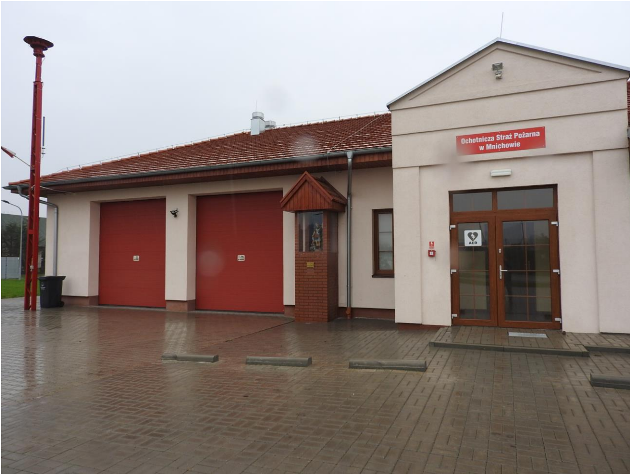
Sala wiejska i remiza strażacka