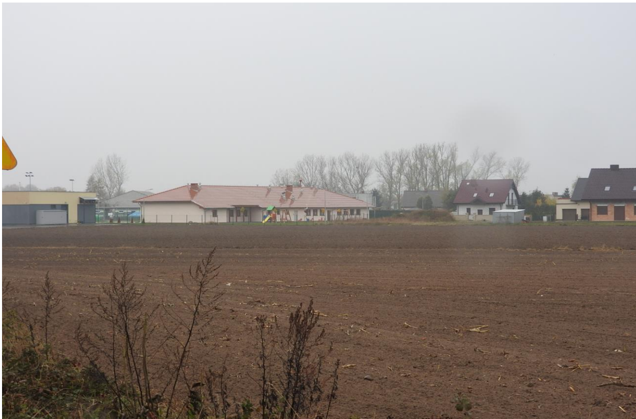
Widok Sali wiejskiej i pól uprawnych otaczających wieś