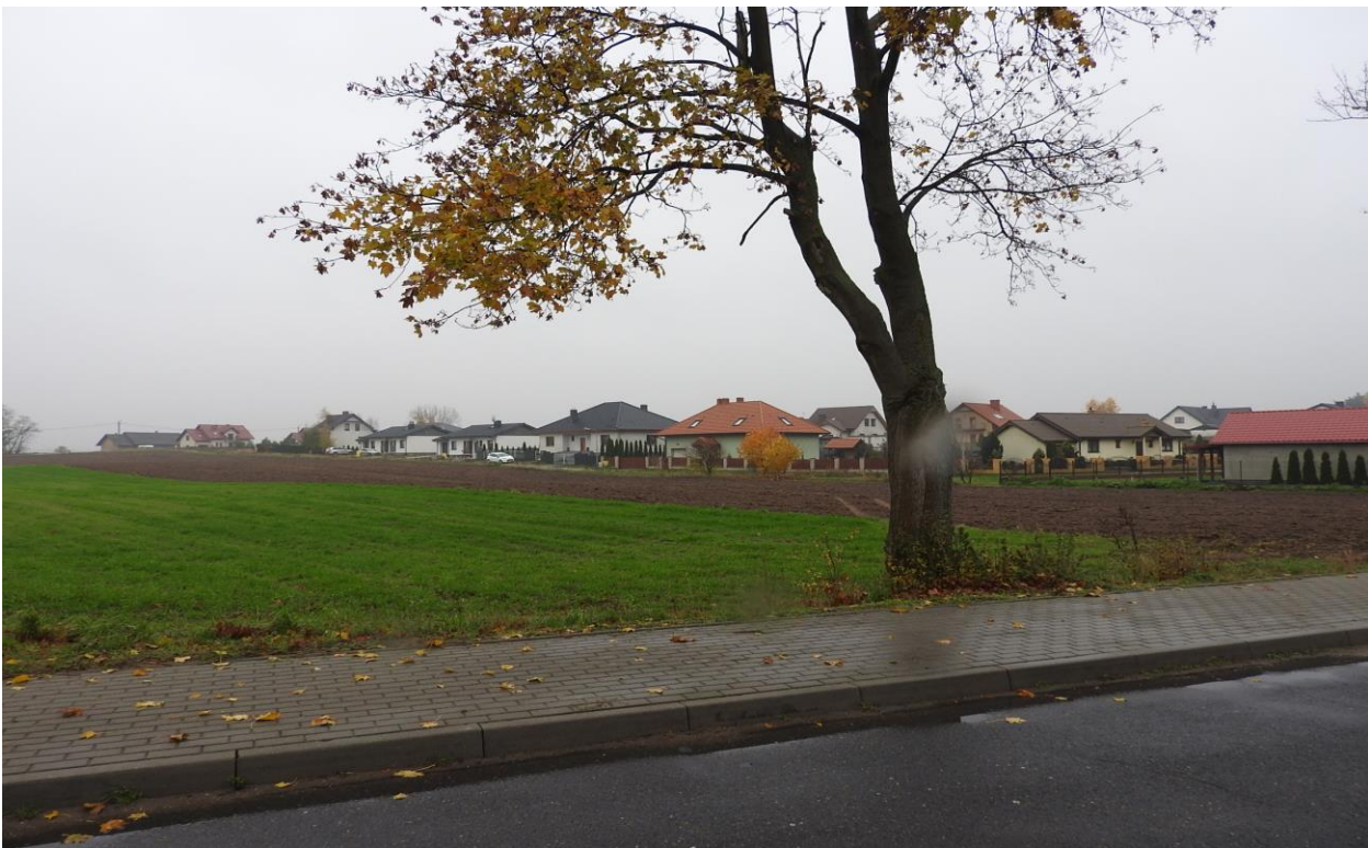
Pola uprawne i budujące się osiedle domków jednorodzinnych