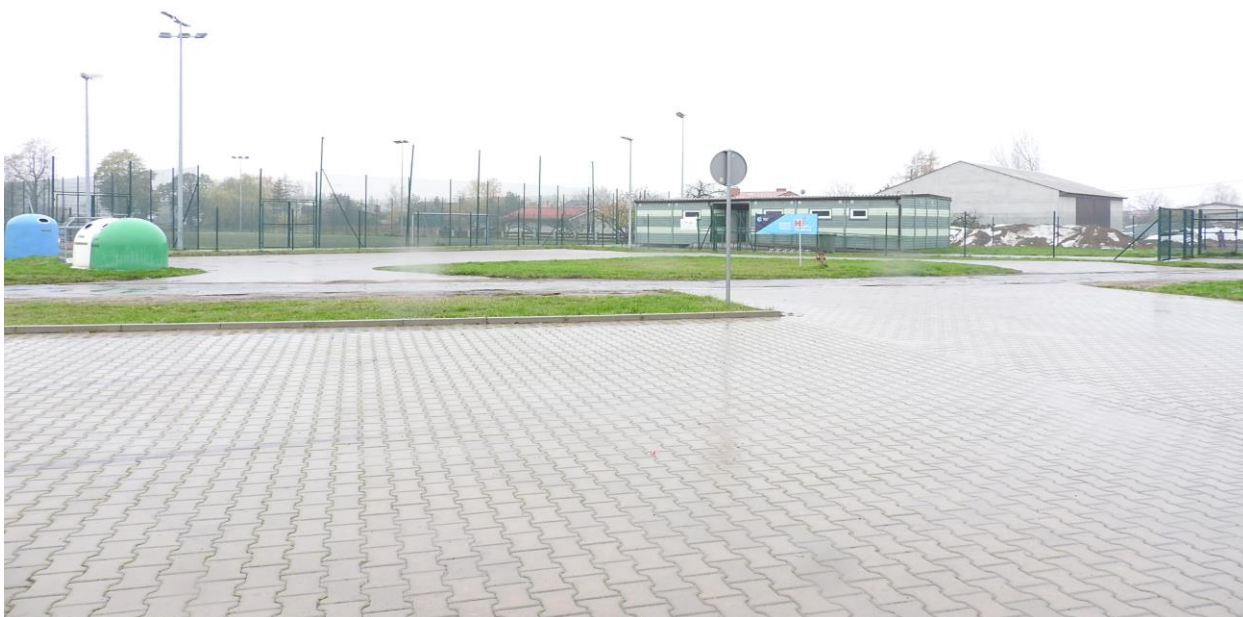
Kompleks ORLIK 2012 i tereny do zagospodarowania