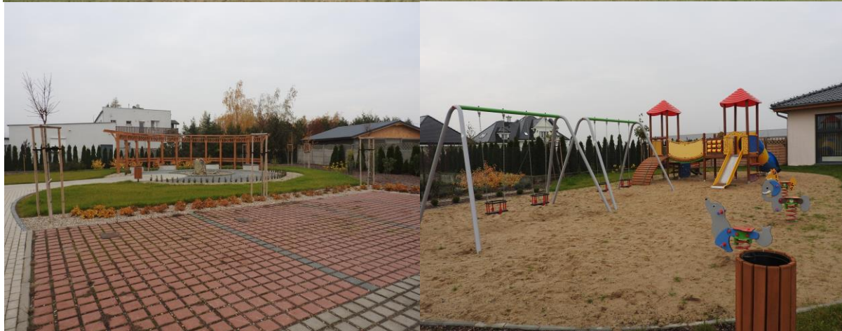
Kompleks Sali wiejskiej i terenów rekreacyjnych wokół Sali sołectwa Piekary