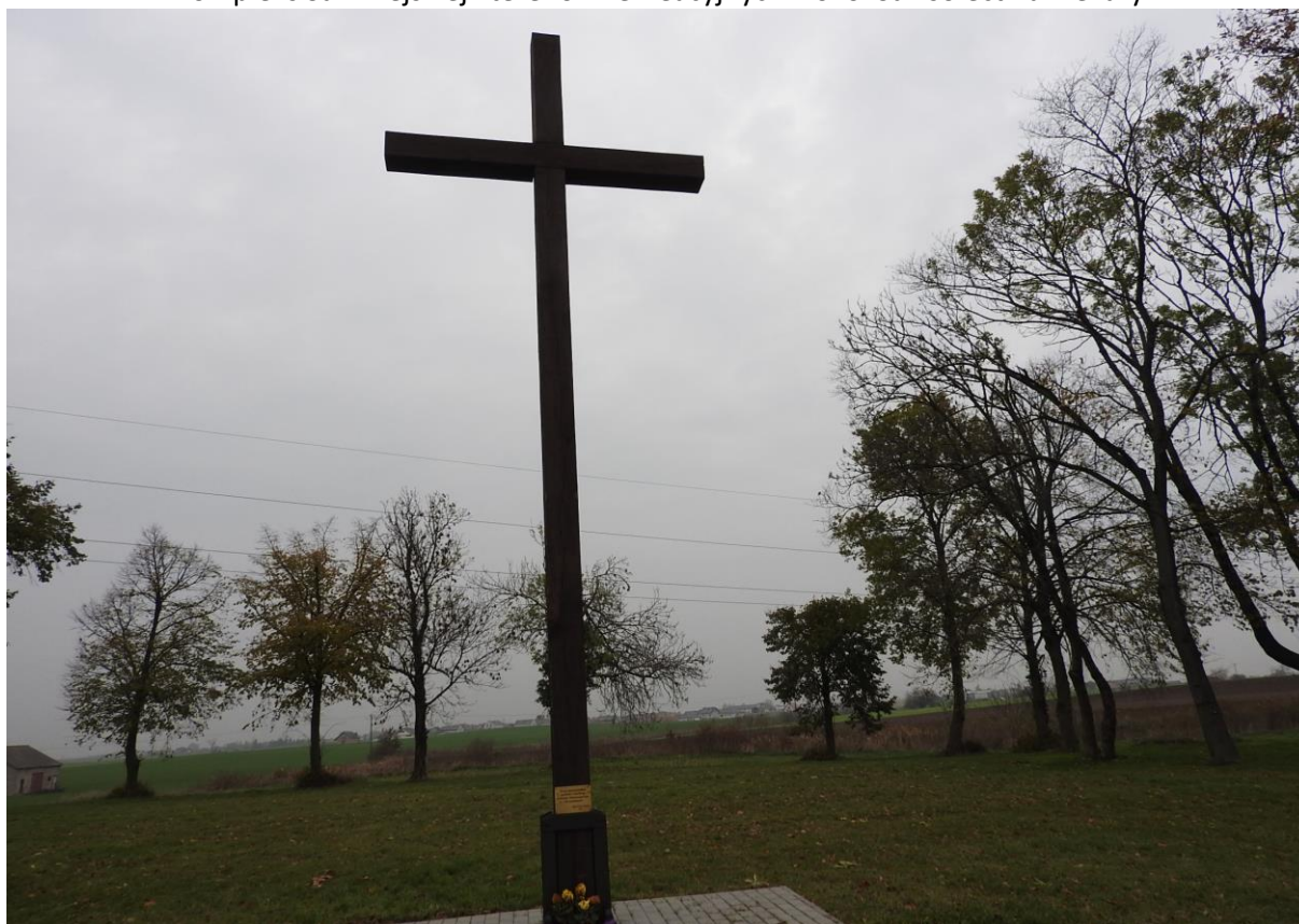
Historia pamięci przodków sołectwa Piekary