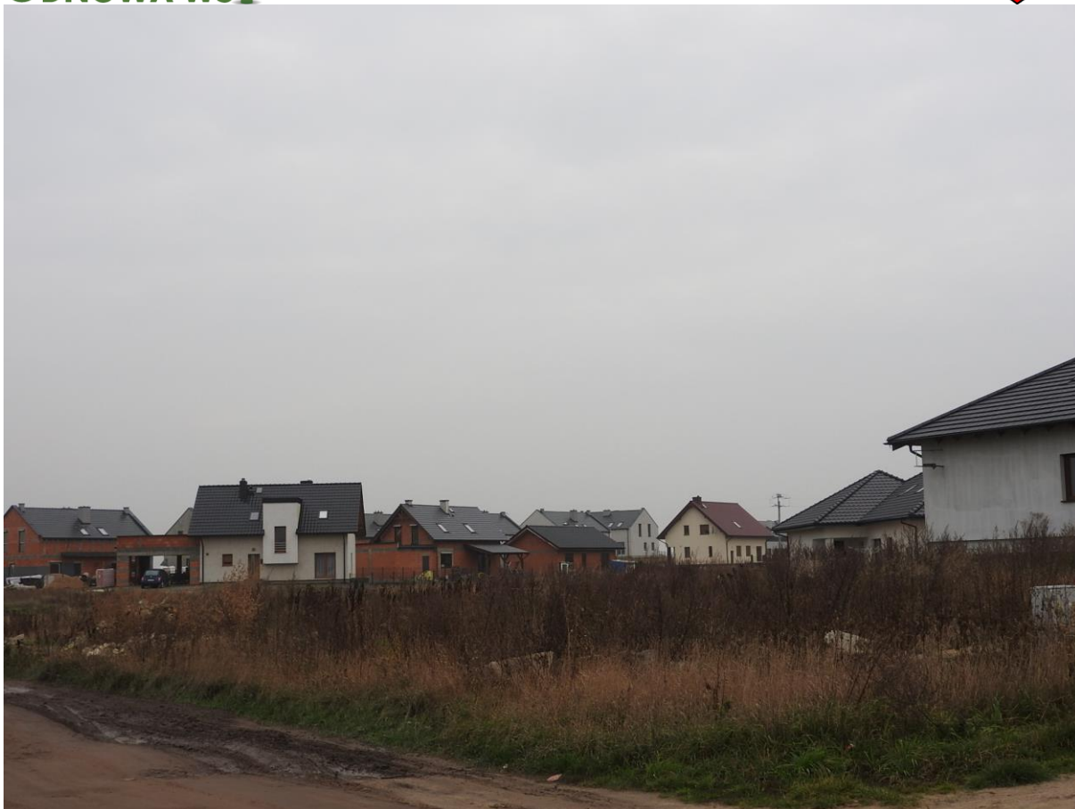
Postępująca urbanizacja wsi, Piekary są wchłaniane przez miasto Gniezno, ogromny brak infrastruktury