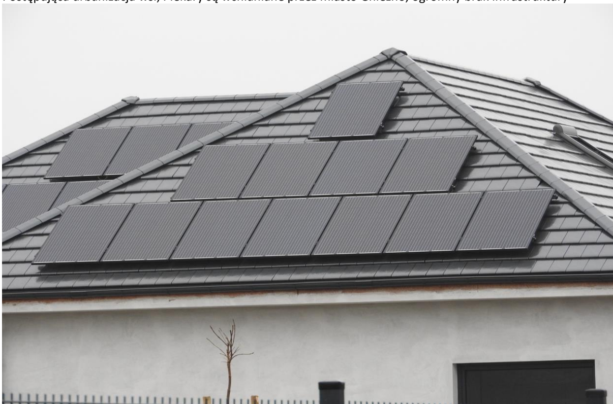
Nowoczesne rozwiązania w nowym budownictwie jednorodzinym